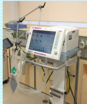
人工呼吸器 (呼吸治療業務)