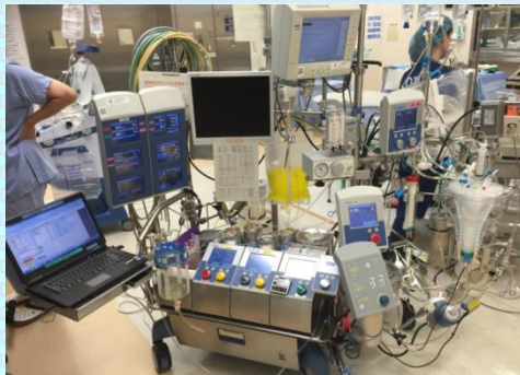
人工心肺装置 (手術室業務)