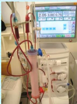
人工透析装置 (血液浄化業務)